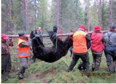
Karhujahti alkoi 2013, kun alueen kanta kasvoi vuosi vuodelta.