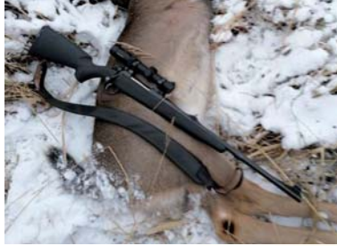
Seuramme on panostanut alusta lähtien aseiden taitavaan käsittelyyn.

liiankin tehokkaasti. Vuonna 1957 liittyiin Keski-Suomen kennelpiiriin ja Suomen Metsästäjäinliiton jäseneksi. 1959 seura teki alallaan maassamme ainutlaatu-