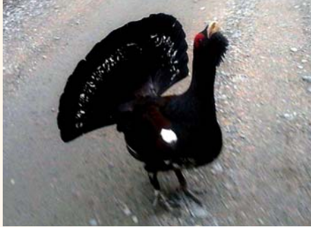
Seuramme sai Suomen metsästäjänliiton riistanhoidon kiertopalkinnon jo 1960-luvulla.

uurastettiin ampumaradan rakentamisessa ja se valmistuttuaan vilkastutti edelleen ampumatoimintaa. Seura piti omia kilpailuja ja jäsenet osallistuivat kisoihin muuallakin. Vuoden 1965 tuhoeläinten