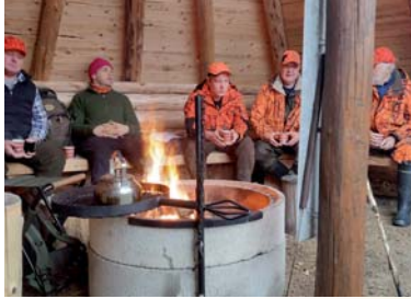
Metsästyksen tueksi seurallamme on käytössään kolme laavua.

elämäntyyli on kuitenkin tuonut seuralle uudenlaisia haasteita, esimerkiksi juuri jäsenistön aktiivisuuden ja kiinnostuksen ylläpitämisessä ja ylipööränsä siinä, että