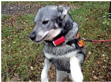
Metsästyskoira GPS-laittein on pettämätön yhdistelmä.

1970-luvulla saattoi ukkometsoja nähdä puoli tusinaa päivässä, lisäksi suuria teeriparvia ja paljon pyitä. Nykyään voi syksyn kuluessa pari metsoa rymistellä lentoon, teeriparvet ovat kutistuneet ja pyykin alkaa olla hakasessa. Ensimmäiseen supikoiraan