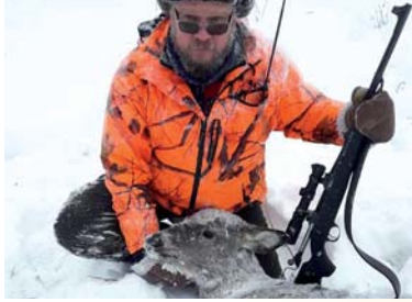
Metsästyskiväärin kiikaritähäimet yleistyivät 1980-luvulla.

jäsen on koira. Kunnan haukku valjastetuna GPS-laittein on pettämätön yhdistelmä. Passiketju pysyy hyvin ajan tasalla ajomiehen ilmoittaessa koiran sijainnin, kulkusuunnan ja nopeuden. Koiran osuus kaatoihin on ollut viime vuosina ratkaiseva. Jahtin päätyttyä haukku löytyy helposti GPS:n avulla. Usein se saattaa löytyä kilometrienkin päästä lähtöpaikasta. Vain kerran kolmen vuosikymmenen aikana on koiramme jäänyt auton töytäisemäksi.