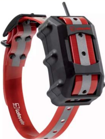
LAFAYETTE GPS C40