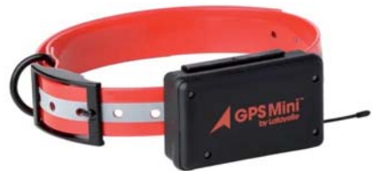
LAFAYETTE GPS MINI