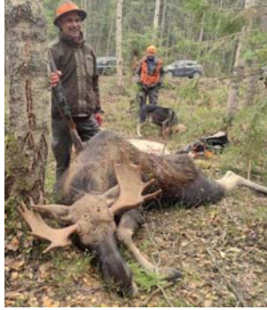
1970-luku oli aktiivista jahti-, näyttely- ja kilpailuaikaa.