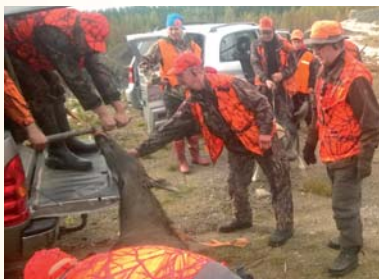
Metsäautoteiden yleistyminen helpotti saaliiden poiskuljetuksia.

Alueemme sijaitsevat kaakkoisessa Keski-Suomessa. Metsästysalueemme pinta-ala on ollut viime vuodet 5 200 hehtaaria. Metsäautoteiden runsasrakentaminen on helpottanut merkittävästi jahtia varsinkin saaliin poiskuljetuksen osalta. Porukan lukumäärä on vaihdellut 6-20 miehen välillä. Määrä on muuttunut suhteessa hirvikannan tiheyteen. Vain innokkaimmat ovat